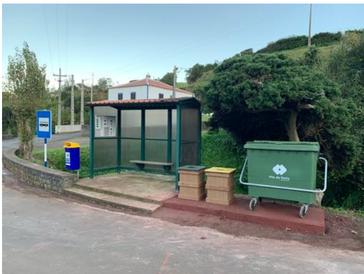
Instalação de ECO PONTOS na semana europeia de prevenção de resíduos, em zonas estratégicas da freguesia.

Por fim, à semelhança de anos anteriores, participamos em várias actividades relacionadas com a reutilização e reciclagem, envolvendo a comunidade da freguesia, em especial os jovens, através de um protocolo de cooperação com o Espaço TIC de Santa Bárbara.